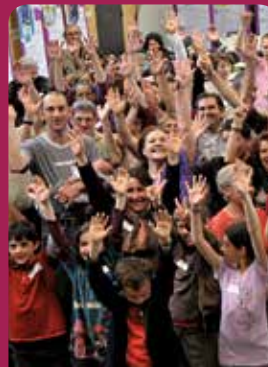
Familles à énergie positive