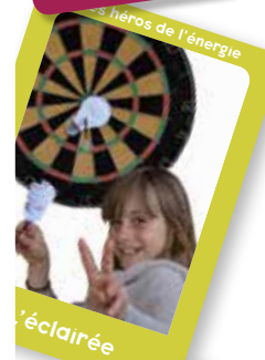
Les héros de l'énergie